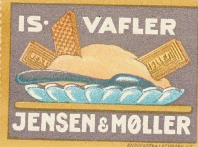
Samlermærke Nr. 150. Jensen & Møller Is-Valler. Tegnet af Poul Jørgensen.