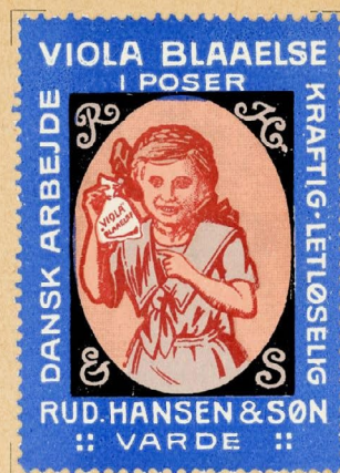
Samlermærke Nr. 196. Viola Blaaelse. Rud. Hansen & Son, Varde. Tegnet af Th. Iversen.