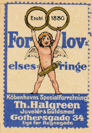
Samlermærke Nr. 74. Forlovelsesringe. Th. Halgreen, Gothersgade 34.