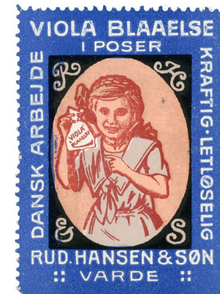
Poster Stamp No. 196. Viola Bluing. Rud. Hansen & Son, Varde. Designed by Th. Iversen.