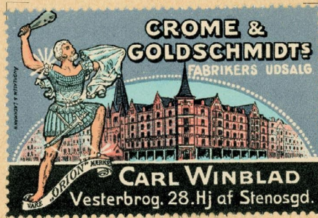
Samlermærke Nr. 88. Crome & Goldschmidts Fabr. Udsalg, Carl Winblad, Vesterbrogade 28.