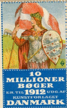
Samlermærke Nr. 12. Kunstforlaget "Danmark" 10 Millioner Bøger.