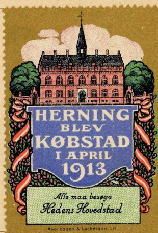
Samlermærke Nr. 43. Herning blev Købstad i April 1913.