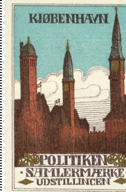
Poster Stamp No. 206. Politiken. Poster Stamp Exhibition. Designed by Architect A. J. F. Brandt (3rd Prize).