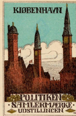
Samlermærke Nr. 206. Politiken. Samlermærke-Udstillingen. Tegnet af Arkitekt A. J. F. Brandt (3. Præmie).