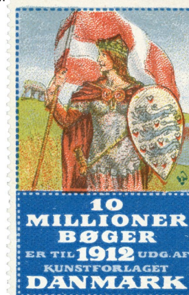
Poster Stamp No. 12 Art Publisher "Danmark" 10 Million Books.