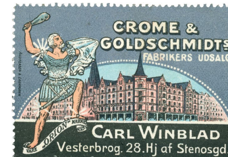
Poster Stamp No. 88. Crome & Goldschmidt's Factory Outlet, Carl Winblad, Vesterbrogade 28.