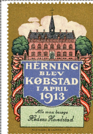
Poster Stamp No. 43. Herning became a "Market Town" in April 1913.