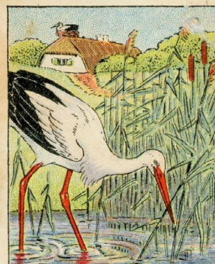
Heymann Bloch's Storke-Billede 5.