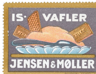
Poster Stamp No. 150. Jensen & Møller Ice Cream Wafers. Designed by Poul Jørgensen.