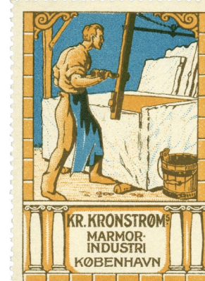
Poster Stamp No. 105. Kr. Kronstrøm's Marble Industry. Designed by Ludvig Jacobsen.