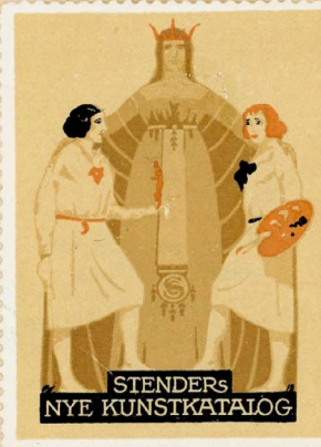
Samlermærke Nr. 207. Stenders Kunstkatolog. 1913. Tegnet af Thor Bogelund-Jensen.