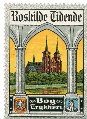
Poster Stamp No. 10 Roskilde Tidende. Released 1912.