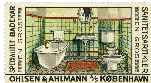
Poster Stamp No. 61. Ohlsen & Ahlmann A/S. Bathtubs and Sanitary Articles.