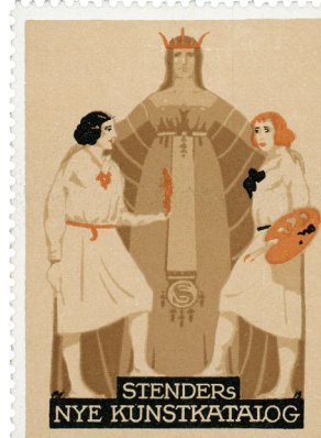
Poster Stamp No. 207. Stender's Art Catalogue. 1913. Designed by Thor Bogelund-Jensen.