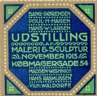
Samlermærke Nr. 223. Maleri- og Skulptur-Udstilling, Købmagergade 54, November 1913. Tegnet af Hans Rasmussen.