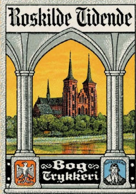
Samlermærke Nr. 10. Roskilde Tidende. Udsendt 1912.