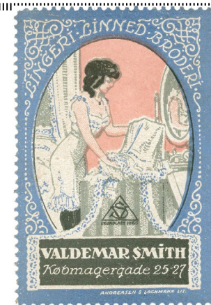
Poster Stamp No. 85 Vald. Schmidt, Købmagergade 25, Designed by Th. Iversen.