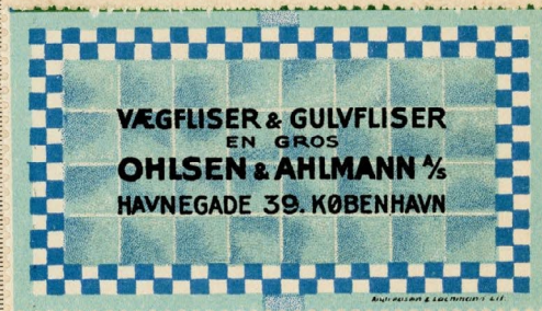
Samlermærke Nr. 60. Ohlsen & Ahlmann A/S. Vægfliser og Gulvfliser.