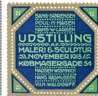
Poster Stamp No. 223. Painting and Sculpture Exhibition, Købmagergade 54, November 1913. Designed by Hans Rasmussen.