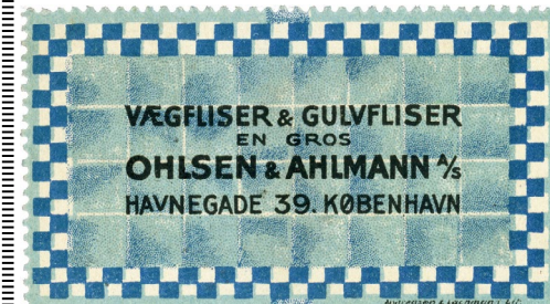
Poster Stamp No. 60. Ohlsen & Ahlmann A/S. Wall Tiles and Floor Tiles.